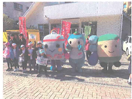
えのでんはうす前で募金活動を行う「えのん」(右)とキッズダンスサークルのみなさん

平成26年度より、鎌倉市・藤沢市支会と県募金会が連携して、沿線地域の福祉活動を支援することを目的に、全国初となる鉄道会社との協働を、江ノ島電鉄株式会社(藤沢市片瀬海岸)と開始しました。平成30年度は協働事業5周年の節目を迎えたことから、1月12日と19日の二日間、「えのでんはうす」(藤沢市片瀬海岸)で赤い羽根とのコラボ缶バッジによる募金活動を実施しました。当日は、同社キャラクター「えのん」が募金活動に登場し、タウンニュースに写真入りで掲載されました。また、電車内及び沿線全15駅に、ポスターを無償で掲示していただきました。