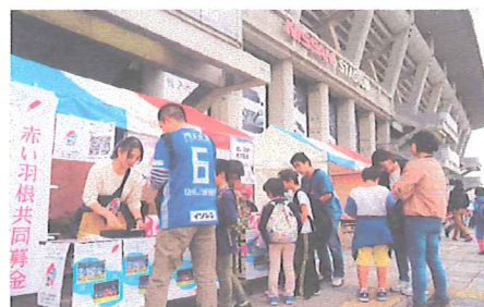
横浜Fマリノスのホームゲームが行われた日産スタジアムでのイベント募金

横浜F・マリノスから、ポスターに使用する試合中の写真を無償で提供していただきました。また、横浜市域向けの全戸配布資料に、同チームからの応援メッセージを掲載しました。さらに、募金期間中に日産スタジアムで開催された公式戦（11月3日、FC東京戦）の会場に、共同募金ブース（写真）を無償で設置していただき、チームキャラクター“マリノスケ”と赤い羽根をデザインした募金バッジなどを使用して、募金・広報活動を展開しました。なお、マリノス公式ショップでも、募金期間中に卓上募金箱を設置して、バッジ募金の呼びかけに協力していただきました。さらに、大和市支会では、チームのスクールコーチと「赤い羽根・マリノスケと遊ぼう！」（11月18日）というイベントを中央1号公園で開催して、サッカーボウリングやチャリティーオークションなどの企画を通じて、多くの子ども達に共同募金に親しんでもらうことができました。