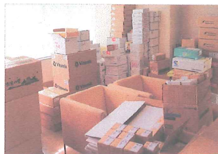
県募金会の事務所に届けられた多種多様な企業各社からの株主優待品

株式会社日本トラスティ・サービス信託銀行（東京都中央区）は、信託業務を通じて企業各社から寄せられる株主優待品を、さまざまな公益事業へ還元しています。平成29年度に、県内で支援を必要とされる方々への優待品の活用方法を協議し、同年より継続的に県募金会へ寄贈していただけることになりました。平成30年度は3回（7月、12月、3月）の寄贈があり、企業156社からの1,247点（563万6,660円相当）の株主優待品を、児童福祉施設や県内在住の難民の方々へ現物配分を行いました。