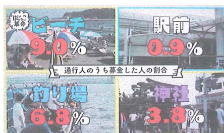
NHK総合テレビで放送された「はじっこ革命」の映像 ※転載不可

第一弾の番組放送に大きな反響があったため、NHK歳末たすけあい、海外たすけあいの時期に合わせて、当局から第二弾の制作提案があり、引き続き番組制作の協力を行いました。日産スタジアムでは「巨大アート募金箱」を使用した募金活動を、アクセサリー商品の店舗「アネモネ」を運営する株式会社サンポークリエイトでは、「ラグジュアリーマネー」の名称を採用した募金活動などを実践しました。12月21日の放送日以降、歳末たすけあいの寄付額が増加し、平成30年度のNHK歳末たすけあいは、対前年度実績を大きく上回る成果が寄せられました。