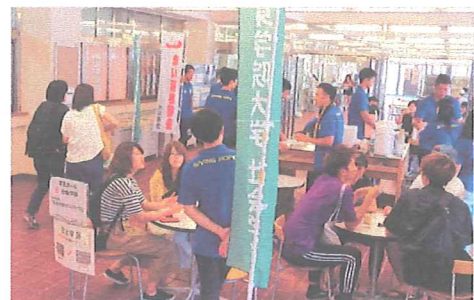
オープンキャンパスの参加者に大学と共同募金会の協働内容等を説明する社会学部の学生たち

平成 27 年 4 月 18 日、全国初となる共同募金会と教育機関(学校法人関東学院)との「共同宣言」を行い、協働 4 年目となる平成 30 年度も、引き続き関東学院大学社会学部の学生を中心に、「若い力と地域の力で未来を拓く」をコンセプトとしたさまざまな活動を展開しました。