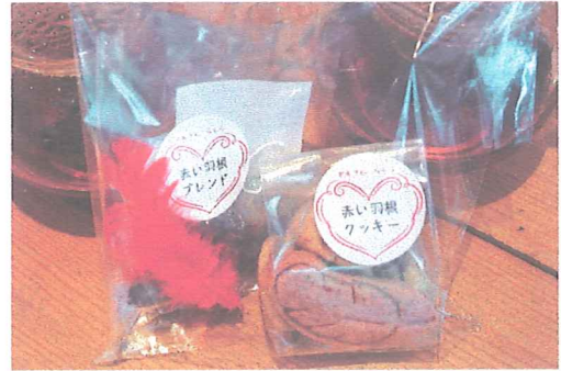
赤い羽根型クッキーとハーブティーをセットした寄付つき商品

平成28年度から、秦野市内の障がい者自立・就労訓練施設「松下園」との協働による寄付つき商品「幸せ餃子」(商標登録済)の販売も継続しています。平成30年度は、新たに川崎市麻生区内の「があでん・ららら」との協働により、赤い羽根をかたどった寄付つき商品(クッキー等)の開発を、川崎市麻生区支会と同市支会連合会とともに進めました。