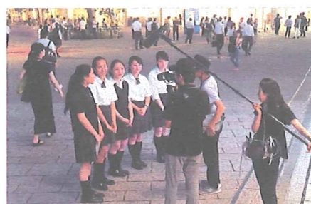
街頭募金活動を終えて取材を受ける関東学院六浦高等学校の生徒たち