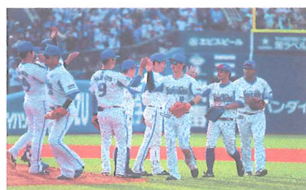
ポスター用に提供された試合中の画像

横浜DeNAベイスターズから、ポスターに使用する試合中の選手画像を無償で提供していただきました。また、全戸配布資料の県域版に、ポスター画像とともにチームからの応援メッセージを掲載しました。