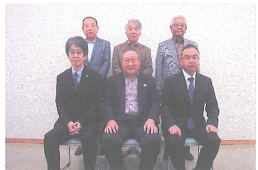
横浜市青葉区内で行われた協定書署名式へ参加された地元自治会・地区社協・環境NPOのみなさん

横浜市内の家庭から出る資源物が、共同募金の寄付金になる全国初の「わが家の資源で横浜の福祉を支えようプロジェクト」を、NPO法人横浜市集団回収推進部会、横浜市資源リサイクル事業協同組合、横浜市社会福祉協議会と県募金会の4者による協働事業として、平成26年度から開始しました。同プロジェクトは、地域で回収された資源物（古紙・古布）の回収量1トン当たり50円が共同募金となり、寄付金は資源物が回収された地域の地区社会福祉協議会を通じて、市民に地域福祉活動として還元される仕組みです。平成30年度は、前年度までの7地区（旭区：希望が丘連合自治会・希望が