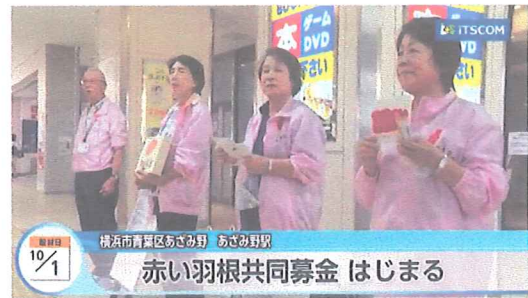
地元ケーブルテレビ(イツツ・コミュニケーションズ)で放送された駅頭での募金活動(東急電鉄・あざみ野駅) ※転載不可

鉄道会社の協力を得て、毎年、駅頭での街頭募金活動を展開しています。平成30年度も東日本旅客鉄道株式会社、相模鉄道株式会社、小田急電鉄株式会社、東京急行電鉄株式会社、京王電鉄株式会社、江ノ島電鉄株式会社、京浜急行電鉄株式会社、横浜市交通局、株式会社横浜シーサイドライン等の協力により、各駅頭での募金活動を非営業行為として承認していただき、県内の鉄道駅構内での街頭募金は2,799万円を超える成果がありました。