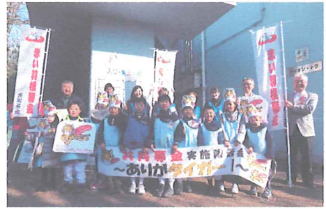
野毛山動物園・スマトラトラの獣舎前で開催した共同募金実施報告会

共同募金運動の実施に当たり、県募金会では平成14年度から動物をモチーフにしたキャラクターを使用した募金バッジ等を製作して、募金・広報活動を展開しています。また、平成24年度からは、横浜市支会と野毛山動物園（横浜市西区）と協働して、キャラクターとなった人気動物を共同募金のPR大使に委嘱して、運動を盛り上げる企画を行ってきました。平成30年度も引き続き大使就任セレモニー等のイベントを、動物園と横浜市支会と連携して実施しました。