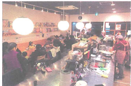
地域コミュニティの場としてにぎわう川崎市内の子ども食堂

株式会社大和ネクスト銀行(東京都千代田区)との協働により、同行の個人・法人向けの定期預金に、頑張っている人や団体を応援する「えらべる預金」を開設して、その中でこどもの自立支援を目的とした「こども食堂応援定期預金」の一部が、北海道、神奈川県、石川県のこども食堂への活動資金として共同募金へ寄付されることになりました。県内の支援先を個別に選定するために、平成31年1月に同行スタッフとともにこども食堂の現地視察を行い、「地域食堂めさみーる+メサグランデ」(写真/川崎市中原区)と「ずし子ども0円食堂プロジェクト」(逗子市)の2団体を支援対象とすることが決定されました。