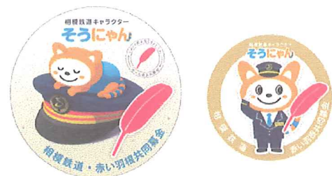
相鉄キャラクターのそうにゃんと赤い羽根のコラボ缶バッジ

平成28年度より、沿線地域11支会を対象とした相模鉄道株式会社(横浜市西区)との協働を開始しました。乗客の方々に共同募金を理解していただくことを目的に、平成30年度も同社キャラクター「そうにゃん」と赤い羽根をデザインした缶バッジを製作して、駅構内で実施する街頭募金活動で配布しました。