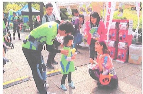
ベルマーレクイーンが募金ボランティアとして参加した湘南ベルマーレのホームゲーム会場

BMWスタジアム平塚で開催された公式戦（10月20日、北海道コンサドーレ札幌戦／11月2日、清水エスパルス戦／11月19日、町田セルビア戦）では、会場に共同募金ブースを設置して、チームの公式ユラフォームと赤い羽根をデザインした募金バッジやステッカーを使用した募金・広報活動を、チームのホームタウンを