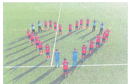
ポスター用に提供された選手とスタッフによるハートの人文字写真

ノジマステラ神奈川相模原から、ポスター用の画像として、監督・選手・コーチの集合写真等は無償で提供していただきました。また、相模原市域向けの全戸配布資料に、同チームからの応援メッセージを掲載しました。募金期間中に相模原ギオンスタジアムで行われた公式戦（10月6日、セレッソ大阪堺レディース戦）の会場