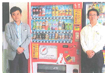
株式会社アツギの社員食堂に設置していただいた共同募金仕様・自動販売機(3 台)

平成 19 年度より、飲料が売れるたびに一定額(率)が共同募金寄付金として取り扱われる「共同募金仕様・自動販売機」の設置を開始しました。平成 29 年度は、飲料メーカー等 23 社との協働により 35 台を増設し、県内設置総数は 222 台となりました。自販機を通じた寄付金は、対前年度比 174 万 3,051 円増の 479 万 139 円となりました。また、1 回利用されるたびに利用料の 1%が共同募金の寄付金として取り扱われる「共同募金仕様・証明写真装置」も、相模原市役所および同市南区・緑区合同庁舎に継続的に設置していただき、県内設置総数 3 台により、平成 29 年度は 2 万 4,997 円の寄付を受け入れました。