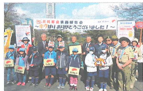
野毛山動物園・レッサーパンダの獣舎前で開催した共同募金実施報告会

共同募金運動の実施に当たり、県募金会では平成14年度から動物をモチーフにしたキャラクター募金バッジ等を製作して、募金・広報活動を展開しています。また、平成24年度からは、横浜市支会と野毛山動物園（横浜市西区）と協働して、キャラクターとなった動物を共同募金のPR大使に委嘱して、運動を盛り上げる企画を行っています。