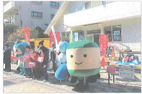
えのでんはうす前で募金活動を行う「えのん」と障がい者施設「虹の子」のみなさん

活動を支援することを目的に、全国初となる鉄道会社との協働を、江ノ島電鉄株式会社（藤沢市片瀬海岸）と開始しました。平成29年度も引き続き1月13日に「えのでんはうす」で、赤い羽根とのコラボ缶バッジによる募金活動を実施しました。当日は、同社キャラクター「えのん」が募金活動に登場し、タウンニュースに写真入りで掲載されました。また、電車内及び沿線全15駅に、ポスターを無償で掲示していただきました。