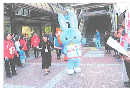
横浜駅周辺でのオープニングセレモニーに登場するマルタ

平成25年度より、株式会社ピローズ(東京都中央区)との協働により絵本「マルタの冒険」(宮島永太良氏作)の主人公で、tvkやCSキッズステーションのテレビ番組に出演中の「マルタ」が、赤い羽根サポーターとして県内のイベントで活躍しています。平成29年度もサッカーJリーグの試合会場や、地域の福祉まつり等の募金活動に登場し、イベントを盛り上げてくれました。また、同社が主催する絵画展の会場への募金箱の設置や、CSテレビで共同募金CMを無償放映していただきました。