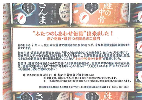
販路拡大用に作成した缶詰の広報チラシ

関東学院大学と宮城学院女子大学の学生が中心となって、売り上げの一部が共同募金の寄付金(1 個当たり 50 円)となる「ふたつのしあわせ缶詰」を、平成 28 年度に制作しました。缶詰は、さんまと鮭の中骨の 2 種で、大学生がラベルのデザインを担当。東日本大震災で被災した宮城県の「木の屋石巻水産」が製造と販売を行っています。商品の販路拡大のために、平成 29 年度に開催した本会理事会・評議員会で商品の紹介を行いました。その結果、横浜および川崎両市内の自治会・町内会等の災害備蓄品などの用途で、総計 2,064 個が販売され、寄付金総額 10 万 3,200 円は、宮城県と神奈川県内の共同募金寄付金(支会扱い)として計上しました。