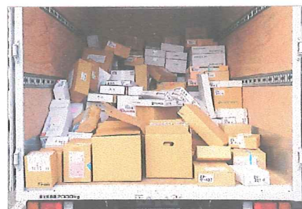
トラックに積み込まれた企業61社からの株主優待品316点

株式会社日本トラスティ・サービス信託銀行(東京都中央区)は、信託業務を通じて企業各社から寄せられる株主優待品を、さまざまな公益事業へ還元しています。平成29年度より、県内で支援を必要とされる方々への優待品の活用方法を協議し、新たに県募金会を通じて継続的に受け入れていくことになりました。平成30年3月に第1回の寄贈があり、企業61社からの316点の優待品(米、レトルト食品、日用品、知育玩具など)を、児童福祉施設や県内在住の難民の方々へ現物配分を行いました。