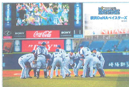
ポスター用に提供された試合中の画像

横浜DeNAベイスターズから、ポスターに使用する試合中の選手画像を無償で提供していただきました。また、全戸配布資料の県域版に、ポスター画像とともにチームからの応援メッセージを掲載しました。