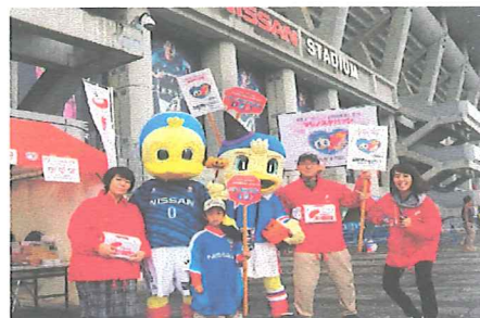
横浜F・マリノスのチームキャラクターも応援に駆け付けた日産スタジアムでのイベント募金

横浜F・マリノスから、ポスターに使用する試合中の写真を無償で提供していただきました。また、横浜市域向けの全戸配布資料に、同チームからの応援メッセージを掲載しました。さらに、募金期間中に日産スタジアムで開催された公式戦（10月14日、大宮アルディージャ戦）の会場に、共同募金ブース（写真）を無償で設置