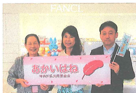
共同募金会を通じて社会貢献活動の企画等を行う(株)ファンケルの CSR スタッフ

株式会社ファンケル(横浜市中区)は、平成 25 年度より、同社製の女性向け商品などを多数寄贈していただいています。平成 29 年度は、洗顔クリーム(1 万 5,696 個)とファンデーション(1,050 個)を寄贈していただき、県内の女性支援施設や高齢者施設など 233 カ所に配分しました。