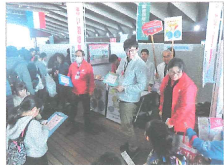
横浜市資源リサイクル事業協同組合等が主催する環境絵日記展でのイベント募金

横浜市内の家庭から出る資源物が、共同募金の寄付金になる全国初の「わが家の資源で横浜の福祉を支えようプロジェクト」を、NPO法人横浜市集団回収推進部会、横浜市資源リサイクル事業協同組合、横浜市社会福祉協議会と県募金会の4者による協働事業として、平成26年度から開始しました。同プロジェクトは、地域で回収された資源物(古紙・古布)の回収量1トン当たり50