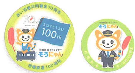
相模鉄道沿線で実施した街頭募金活動用の缶バッジデザイン

平成28年度より、沿線地域11支会を対象とした相模鉄道株式会社（横浜市西区）との協働を開始しました。乗客の方々に共同募金を理解していただくことを目的に、平成29年度も同社キャラクター「そうにゃん」と赤い羽根をデザインした缶バッジを製作して、駅構内で実施する街頭募金活動で配布しました。