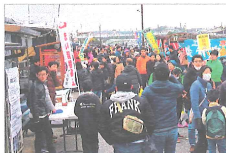
多くの来場者で賑う「海産物フェスタ」での大学生による赤い羽根イベント募金

平成 30 年 2 月 25 日に開催された金沢漁港「海産物フェスタ」(横浜市漁業協同組合金沢支所主催)の会場で、釣り船忠彦丸の協力により、共同募金ブースを設置していただき、大学生を中心にイベント募金を行いました。地元の新鮮な海産物がその場で味わえるなど、毎年大好評のフェスタには、県内外から 1 万人近くの来場者で、当初