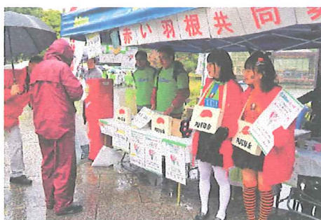
選手やベルマーレクイーンが募金活動に参加した湘南ベルマーレのホームゲーム会場

湘南ベルマーレから、ポスターに使用する試合会場での写真を、無償で提供していただきました。また、湘南地域向けの全戸配布資料に、同チームからの応援メッセージを掲載しました。募金期間中にShonan BMWスタジアム平塚で開催された公式戦(10月7日、水戸ホーリーホック戦/10月29日、ファジアーノ岡山戦/11月19日、町田セルビア戦)では、会場に共同募金ブースを設置して、チームのマスコットキャラクター「キングベルI世」と赤い羽根をデザインした募金バッジやマグネットを使用した募金・広報活動を、チームのホームタウンを主管する5支会(平塚市、茅ヶ崎市、寒川町、大磯町、二宮町支会)と合同で展開しました。さ