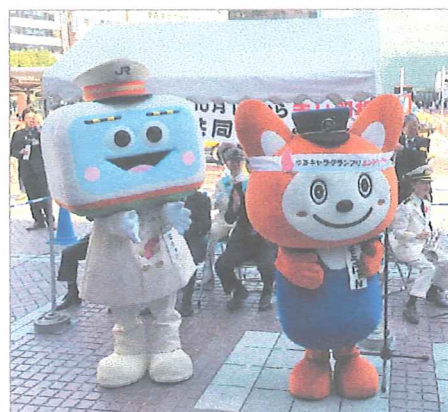
横浜駅のイベント募金に登場した「ハマの電子ちゃん」(JR横浜駅)と「そうにゃん」(相模鉄道)

鉄道会社の協力を得て、毎年、駅頭での街頭募金活動を展開しています。平成29年度も東日本旅客鉄道株式会社、相模鉄道株式会社、小田急電鉄株式会社、東京急行電鉄株式会社、京王電鉄株式会社、江ノ島電鉄株式会社、京浜急行電鉄株式会社、横浜市交通局、株式会社横浜シーサイドライン等の協力により、各駅頭での募金活動を非営業行為として承認していただき、県内の鉄道駅構内での街頭募金は2,854万円を超える成果がありました。