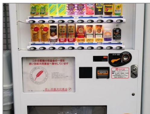
福祉施設や企業を中心に県内約 260 台が稼働する共同募金仕様・自動販売機