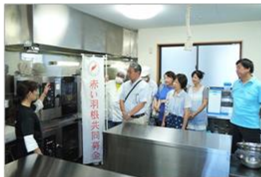
施設長より調理機器を更新したことによる成果等を自治会役員・民生委員の皆さんに説明